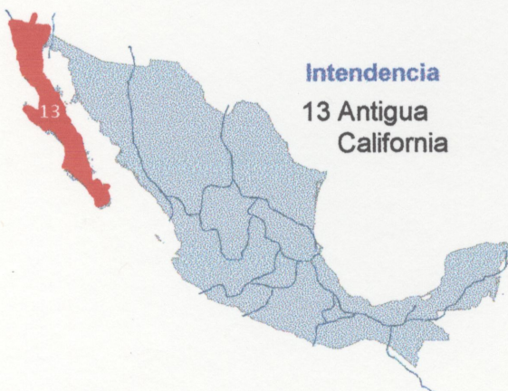
Intendencia 13 Antigua California

Loreto, BC to Mexico. Entire dated April 22, 1812. Transit was 6 months via San Blas, Baja California, Sent by a missionary on his way north. By sea from San Blas (red postmark) to Acapulco, then to Mexico. Only recorded Baja colonial cover. VV7o postmark is unique. Three others with different design are known in different Intendencias. This marking was used to protest the deposing of that king by the French. Scarce as Mexico was in the middle of the Independence war and freeing the king was no longer a popular cause.