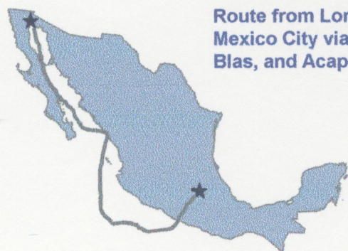
Route from Loreto to Mexico City via San Blas, and Acapulco