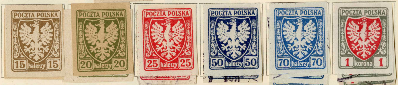
1919. Jänner. Ausgabe für die südlichen Gebiet