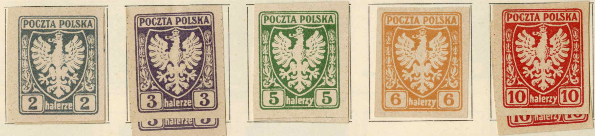
1919. 15. Februar. Krakau. — Steiner